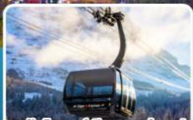
กระเช้า ไอเกอร์เอ็กสเพรส สู่อุดเขาจุงเฟรา

อิตาลี สวิตเซอร์แลนด์ ฝรั่งเศส 10 วัน 7 คืน