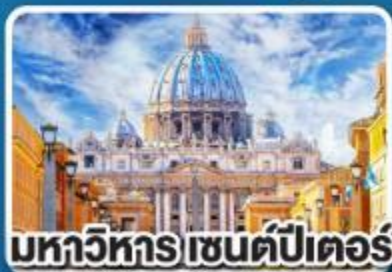
มหาวิหาร เซนต์ปีเตอร์